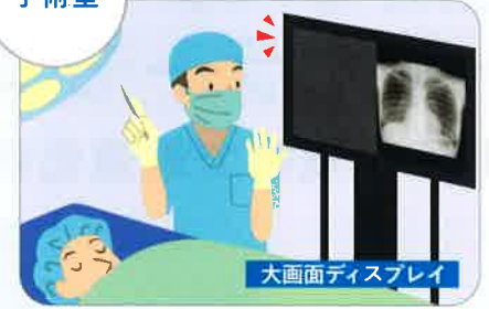
大画面ディスプレイ

大型の4KモニタとFVT-airを組み合わ せて、安価に大画面で鮮明な画像を見 ることが可能です。