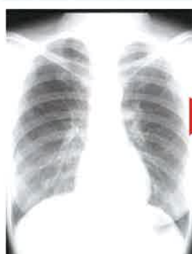
FVT-airあり一般カラーモニタ