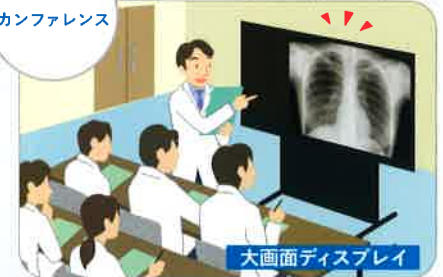
大画面ディスプレイ

大型モニタでの参照も可能です。大規 模な学会や院内全体のカンファレンス にもご利用いただけます。