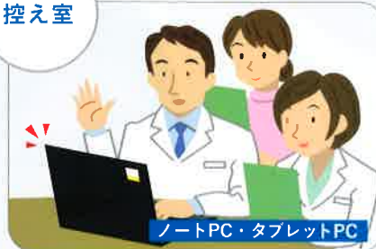
ノートPC・タブレットPC

ノートPCなどのモバイル機器でも使用 が可能です。場所を選ばないため、幅 広い業務のサポートを実現します。