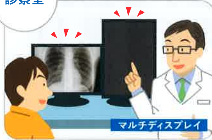
マルチディスプレイ