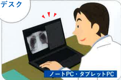
ノートPC・タブレットPC

機能のON/OFFが簡単なため、事務用 PCに導入することで、画像参照も通常 業務も、1台のPCで行えます。